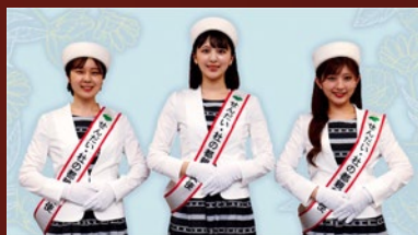
せんだい・杜の都 親善大使